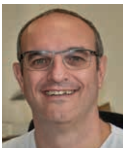
Pr Guillaume CAPTIER